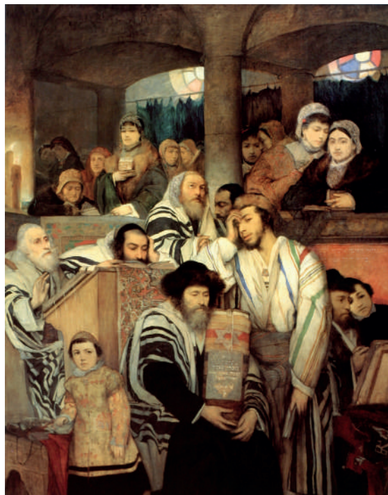
JODEN BIDDEN IN DE SYNAGOGUE OP JOM KIPOER DOOR MAURICY GOTTLIEB - 1878

Deportatie, verbanning, onderdrukking, vervolging en moord volgden sindsdien keer op keer, wat leidde tot de diaspora van het Joodse volk, dat wil zeggen de verspreiding van de Joden over een groot gebied. Zo trokken zij in de eerste en tweede eeuw na Christus onder meer naar Italië en Spanje. Zij bleven echter een speelbal van macht-hebbers: dan weer werden zij gedoogd en zelfs uitgenodigd, dan weer verbannen, vervolgd of vermoord. Vanuit Zuid-Europa trokken de Joden noordwaarts tot in Duitsland en vandaar naar Oost-Europa. Deze laatste migratie gebeurde omdat zij de schuld kregen van pestepidemieën in Midden-Europa en een slechte naam hadden als rentevragende geldschieters.